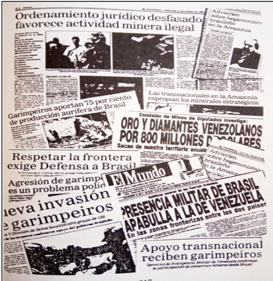
Figura 3 Muestra de titulares y comentarios de la prensa venezolana sobre el conflicto generado por la incursión de los Garimpeiros entre 1989 y 1990