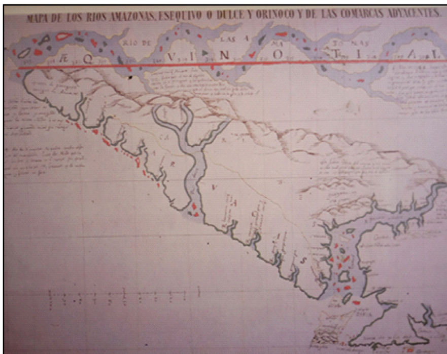
Figura 2 Mapa de los ríos Amazonas, Esequibo y Orinoco y de las comarcas adyacentes. Anónimo, 1556