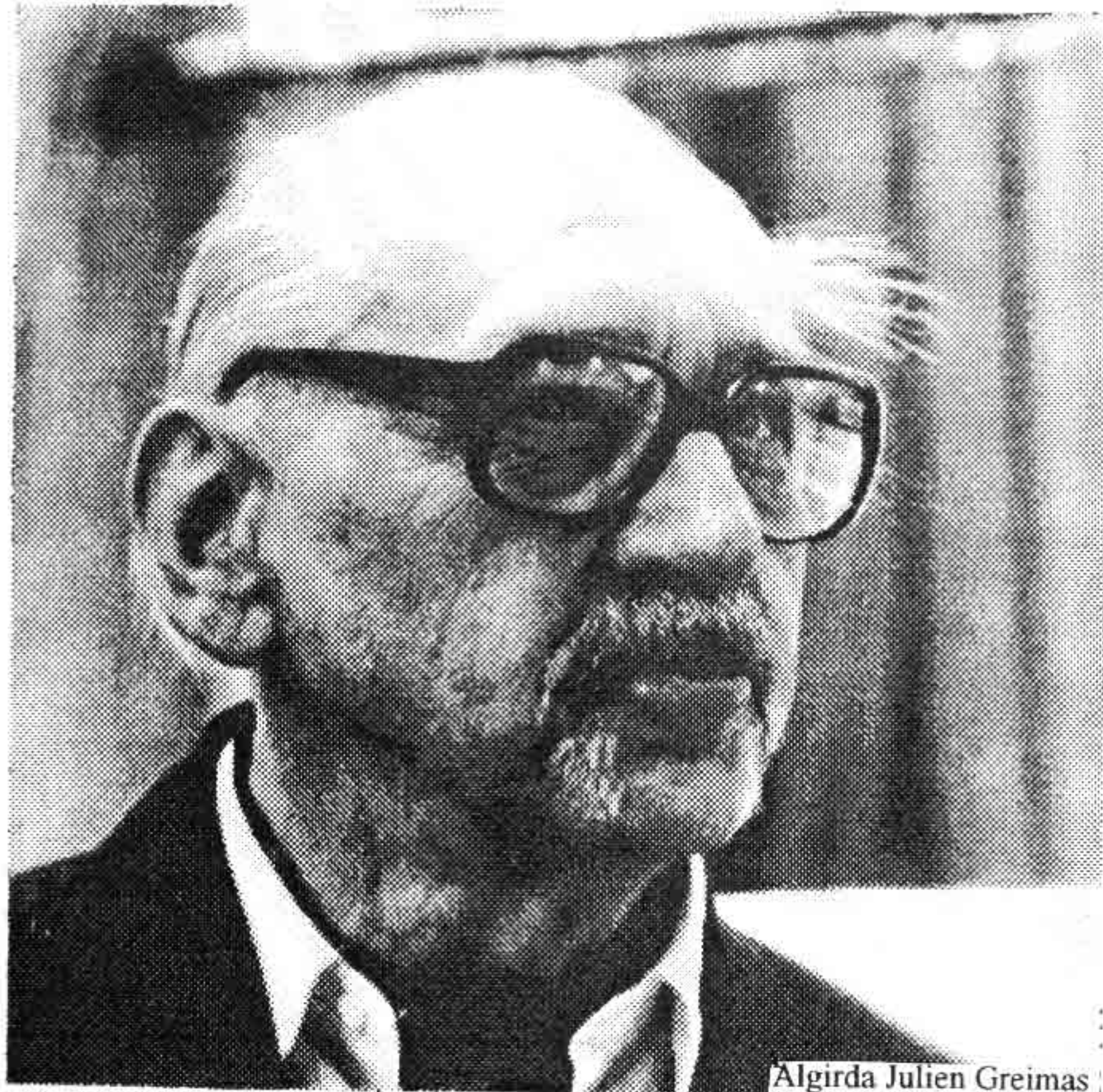
Algirda Julien Greimas

Estas reglas no pueden sino repasar en los conceptos epistemológicos, de gramaticalidad y aceptabilidad que nada aportan a la resolución de los problemas de una teoría semántica.